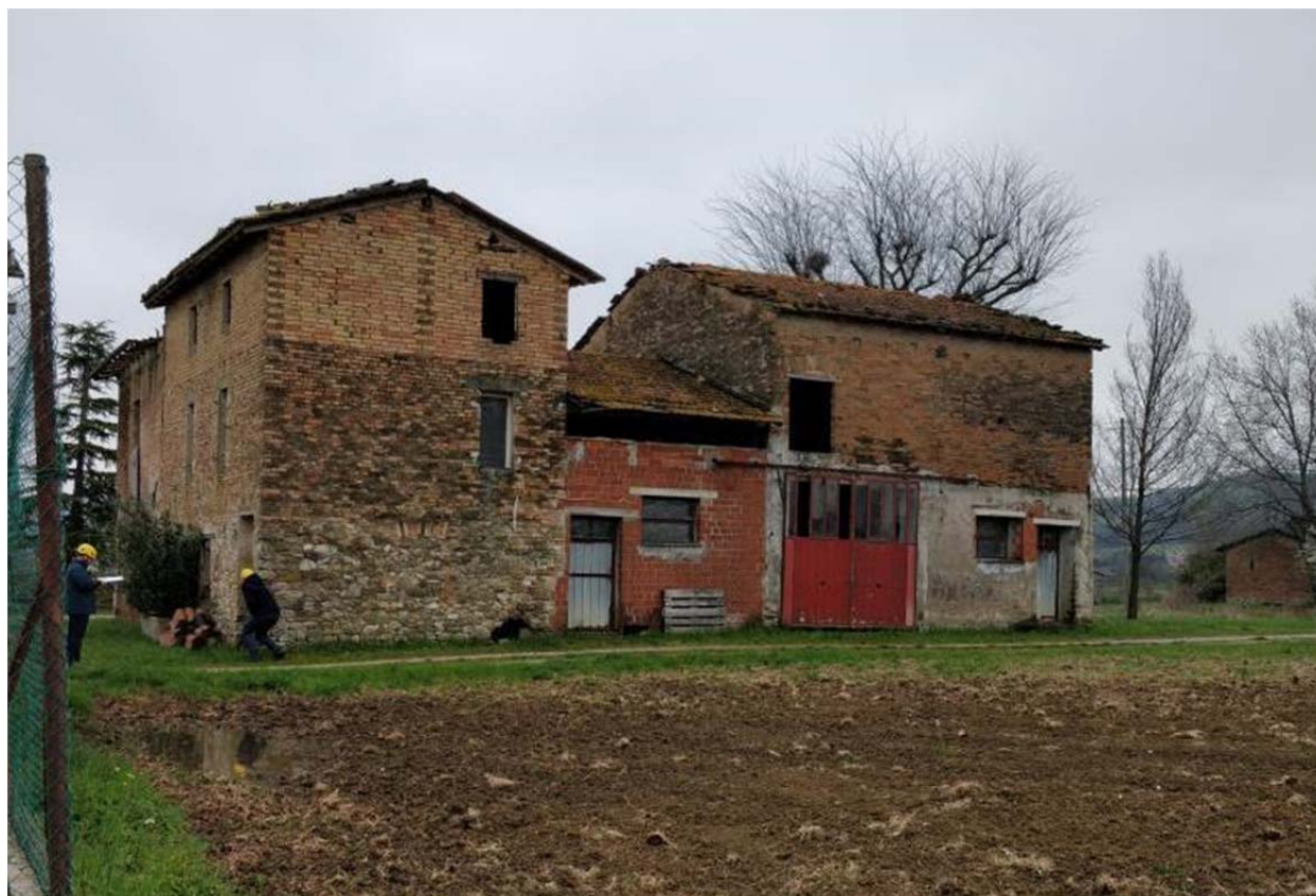
FOTO 4 il complesso stalla fienile e abitazione prospetto ovest