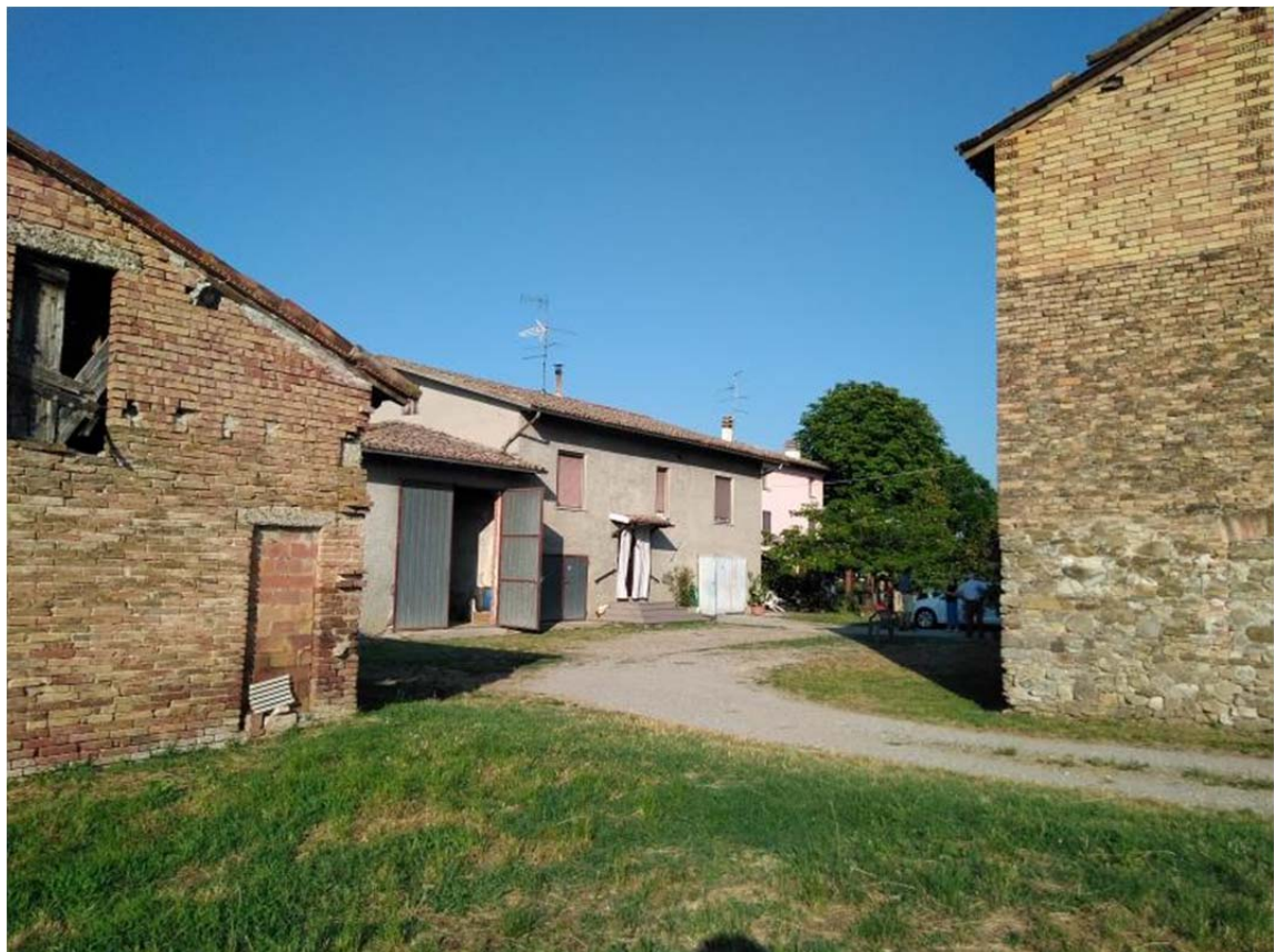
FOTO 6 Interno del complesso