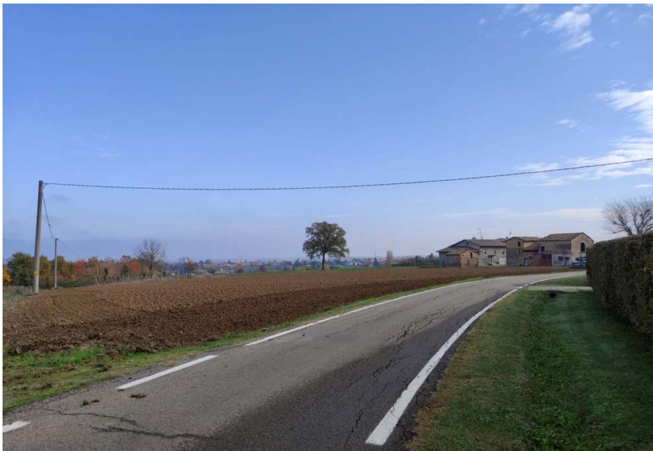
FOTO 3 vista da via Case Rotte, dalla fine del lotto