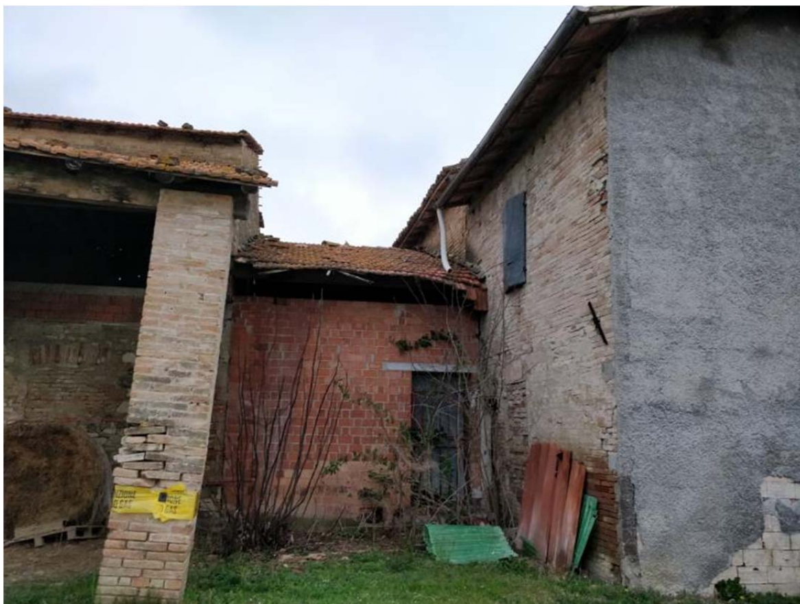
FOTO 7 prospetto est con in evidenza le carenze strutturali