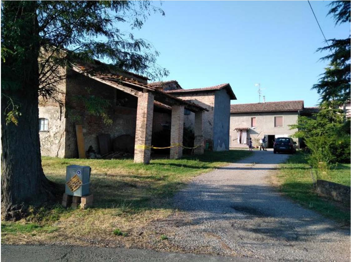
FOTO 5 Stradello di ingresso attuale