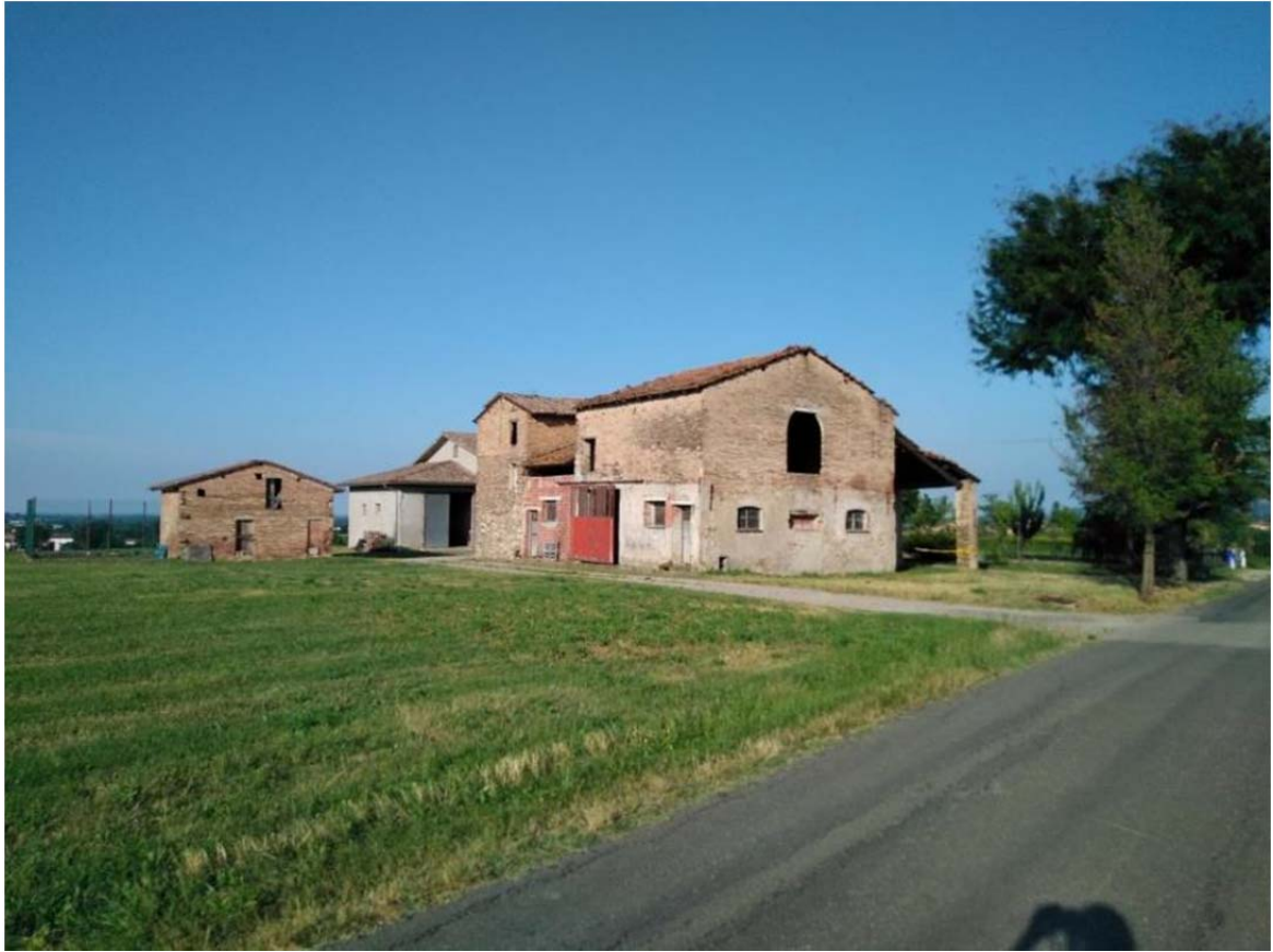
FOTO 1 vista del complesso da ovest